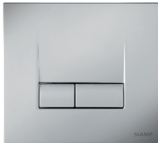
كروم مطفأ فاتح