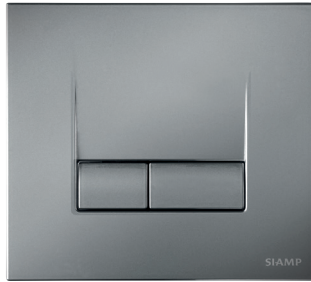
كروم مطفأ داكن