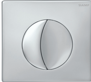
كروم مطفاً (كروم مطفاً للوحة والزر الكبير، كروم لامع للزر الصغير)